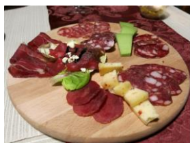
Slika 2: Divjačinski narezek

Na jedilnem listu za začetek ponujajo divjačinski ali brancinov karpačo, lovski krožnik (Slika 2), gratinirane gobice iz krušne peči, postržačo in ajdovo kašo z jurčki.