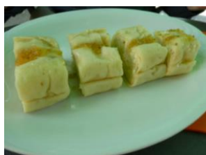
Slika 7: Sirovi štruklji

Posebnost te hiše je klet, v kateri je lepo urejena tudi vinoteka in kjer lahko poskušate različna odprta vina. Na željo gostov v kletnih prostorih postrežejo zaključenim družbam