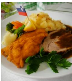
Slika 4: Dunajski zrezek, svinjska pečenka, pražen krompir