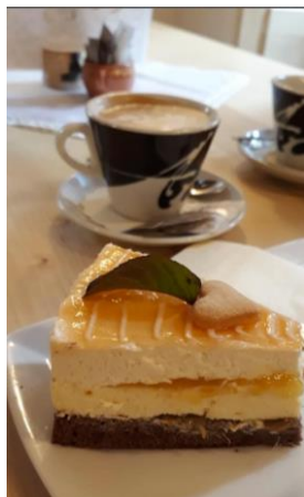
Slika 6: Kava in tortica

V kavarni nudijo poleg kave in drugih napitkov nudili tudi sladice, pri čemer so jih nekaj že poimenovali po junakih iz Tavčarjevega romana Cvetje v jeseni. Tako se bo mogoče posladkati s Presečnikovo Meto ali Kosmovim Janezom, pa tudi s Tavčarjevo tortico. Vse sladice so narejene iz sestavin lokalnih dobaviteljev.