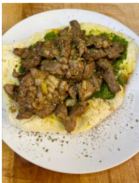
Slika 5: Jetrni obloženih kruhek

Seznam pijač: domači sokovi, čaji, domača kava, domače točeno pivo, domača kvalitetna vina in domače žganice.