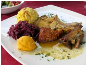
Slika 8: Pečen prašiček in priloge

Pri Boštjanu dobimo kosilo že za kakšnih 10 ali 11 evrov, za kar med juho in sladico prinesejo ocvrtega piščanca ali razne vrste pečenk s prilogami. Drugače pa imajo v ponudbi mnogo lokalnih jedi, veliko jurčkov, sirove krape, žlikrofe, obare, golaž, vampe, pa bifteke, žrebička in divjačino.