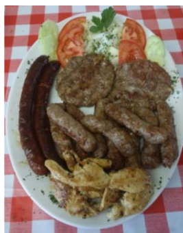
Slika 3: Čevapčiči, pleskavica, klobasice

Na jedilniku restavracije v Kranju vas čakajo prave bosanske specialitete, med njimi seveda različne vrste pit, tarhane, enolončnice, čevapčiči, sudžukica, sarme, baklava, tufahija, tulumbi ... (Slika 3).