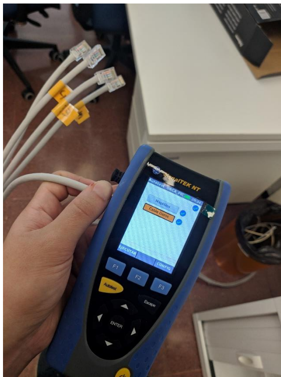
Slika 2: Testiranje UTP kablov

Delal sem še z štirimi sodelavci – dva sta skrbela za trgovino in sprejemni pult za servis, dva pa sta delala z mano v servisu in na terenu. Sodelavci niso znali skoraj nič angleščine, kar pa mi je omogočilo dodatno izpopolnitev mojega znanja španščine, ki sem se jo naučil lani (z nekaj pomoči Google prevajalnika). Podjetje je bilo od mojega stanovanja oddaljeno približno 20 minut z avtobusom.