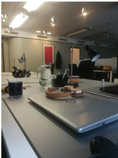
Slika 2: Skupna pisarna

Ta praksa je bila zaradi vpliva korona virusa vsekakor drugačna od ostalih. Prvih nekaj tednov smo lahko delo normalno opravljali v skupni pisarni, čez nekaj časa pa smo se bili primorani preseliti v domače pisarne. Delo smo poskušali opravljati čim bolj tekoče s pomočjo mnogih video klicev, veliko e-poštnih sporočil in seznamov nalog. Kljub delu na daljavo smo obkljukali večino ciljev.