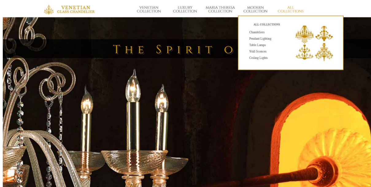
Slika 1: Izgled nove spletne strani

Letošnja praksa je bila, poleg opravljanja stalnih nalog, namenjena zaključku projekta, ki sem si ga zadala za moje diplomsko delo: postavitve nove spletne strani VenetianGlassChandelier ( https://www.venetianglasschandelier.com/ ). Tekom prejšnjega leta smo že veliko naredili, trenutno praktično usposabljanje pa je služilo dokončanju projekta. Dodali smo nove produkte in izvedli končno optimizacijo. Tako je sedaj pripravljena na nove kupce in označuje še en uspešno zaključen projekt podjetja.