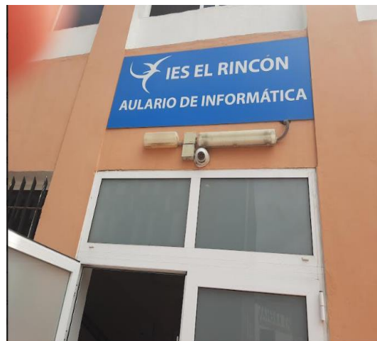
Slika 2: Vhod v šolo IES EL RINCON