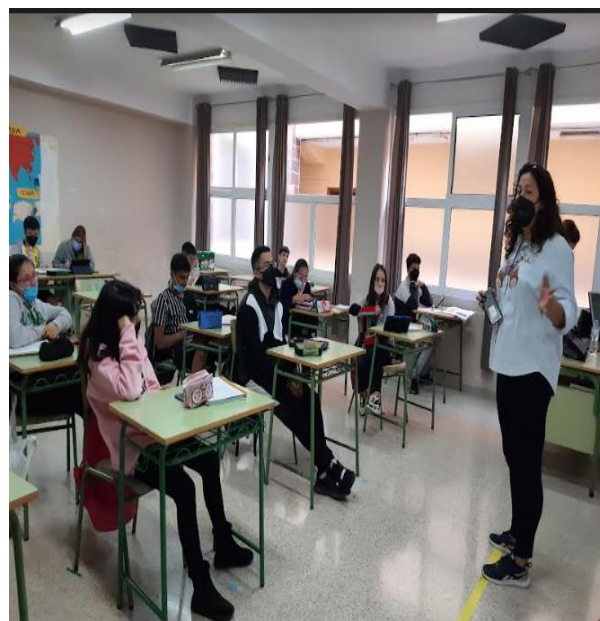
Slika 6: Učilnica med poukom

Svoje bivanje smo popestrile tako, da smo raziskale mesto Las Palmas, ki je na severu otoka in glavno pristanišče. Las Palmas ima vroče puščavsko podnebje in ima povprečno letno temperaturo 21,2 °C. Podale smo se v staro mestno jedro in odkrivale običaje, ki so ji predstavili na odprti tržnici. Naše raziskovanje nas je vodilo tudi do mesta Maspalomas, ki pa je izključno turistično naravnano, z velikimi peščenimi plažami in nasipi kot v puščavi. Na jugozahodu otoka smo odkrile tudi staro ribiško mesto Mogan s tradicionalnimi hišami in okolico. Sam otok pa je večinoma pustinja obdana s skalami in vulkanskimi ostanki. Velik doprinos na otoku pa je, zaradi vetra vzpostavljena, vetrna energija.