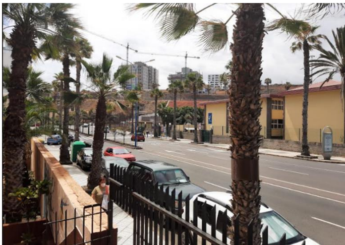
Slika 1: Okolica šole IES EL RINCON