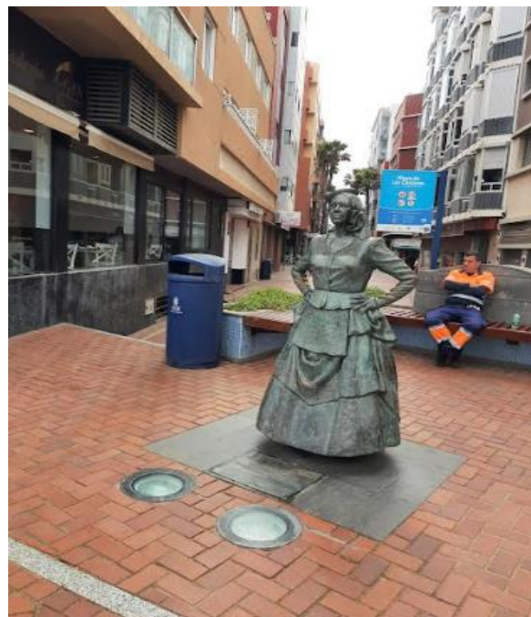
Slika 10: Znamenita žena Gran Canarie, ki čaka svojega mornarja