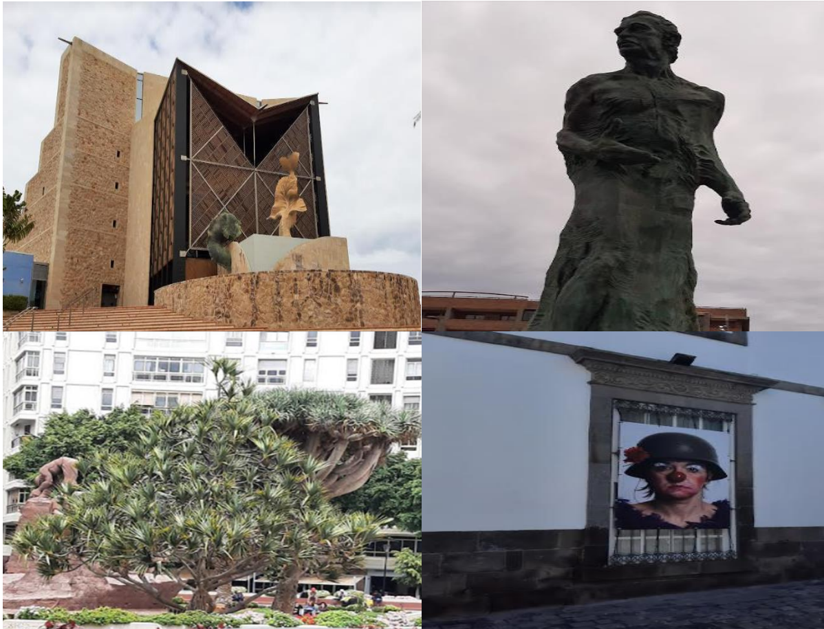
Slika 6, 7, 8, 9: Znamenitosti in mesto Las Palmas