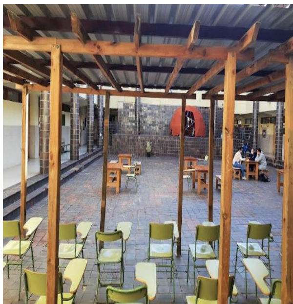
Slika 5: Zunanji prostor šole za druženje

Na šoli so nas sprejeli ravnatelj, pomočniki ravnatelja (imajo jih 4), računovodja ter učitelji, ki so nam predstavili okolico in prostore šole ter vsebino naših aktivnosti. Sprejem je bil po pričakovanjih, prav tako gostoljubje. Za zaključek so nas gostitelji popeljali na zaključno kosilo s tradicionalnimi jedmi dežele Gran Canaria. Nad kulinariko smo bile navdušene, prav tako nad zgovornostjo in odprtostjo naših gostiteljev in njihovih udeležencev izobraževanja. Za učitelje je zelo pomemben čas, ki ga namenijo izobraževanju njihovih učencev, dijakov in študentov, saj želijo, da so njihovi učenci, dijaki in študenti dobro pripravljeni na življenje, ki jih čaka izven šolskih prostorov. Veliko se ukvarjajo tudi z dijaki, ki imajo posebne potrebe in je njihova vključitev v okolje še toliko bolj pomembna, zato imajo za njih ustvarjen poseben projekt, skozi katerega jih učijo osnovnega življenjskega preživetja (kuhanje, nakupovanje, bivanje, pospravljanje, plačevanje, razne zadolžitve). Učiteljem je prav tako zelo pomemben čas po svoji službi, ki ga preživijo v popoldanskem času, saj je to čas, ko so s svojimi družinami.