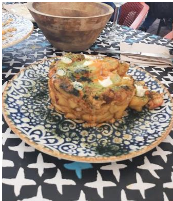
Slika 11: Kulinarika Gran Canarie

Dežela Gran Canaria je kljub svoji vulkansko puščavski pustinja zanimiva, vredna ogleda in vrnitve.