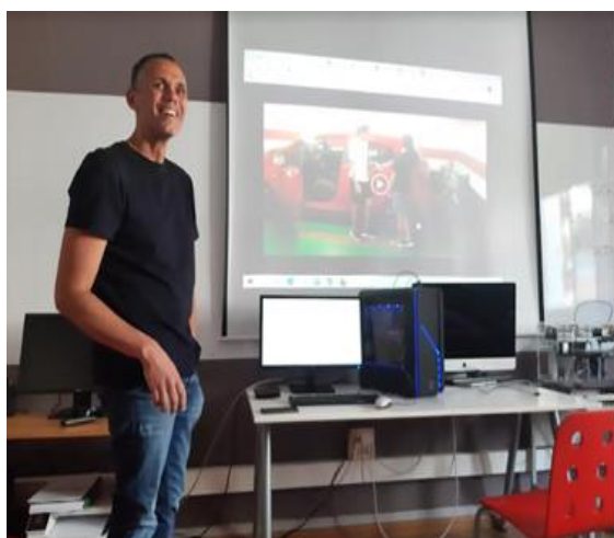
Slika 3: Predstavitev programov in njihovega sodelovanja s podjetji s strani ravnatelja šole

Šola v Španiji po digitalizaciji prednjači pred Slovenijo predvsem v spletnih gradivih, zapiskih in izvajanju izobraževanja ter preverjanju znanja. V Španiji večinoma poteka preko spletnih učilnic in zapiskov v elektronski obliki. S tem želijo tudi zmanjšati rabo papirja na minimum kot »zero waste«, kar je tudi eden od kazalnikov kakovosti, ki jo spremljajo v posebni aplikaciji in se s podatki primerjajo na ravni države tudi z drugimi šolami. Imajo poskrbljeno za računalniško opremo in študenti imajo na voljo vsak svoj računalnik ali tablico, ne samo za rabo v šoli, ampak tudi doma za pisanje nalog in učenje. Zaposlovanje v šoli poteka na ravni ministrstva, šola samo odda namero po številu učiteljev in po predmetih, medtem ko potek zaposlovanja v Sloveniji vodijo šole posamično, vsaka za sebe. Prav tako v Sloveniji šole pridobijo proračunska sredstva s strani države in same izplačujejo ter razporejajo finance za plače in ostale stroške na šoli, medtem ko v Španiji poteka izplačilo plač s strani ministrstva, prav tako večje investicije. Za materialne stroške in manjše investicije pa šole dobijo namenska sredstva, o katerih poročajo dvakrat letno in vodijo enostavno knjigovodstvo.