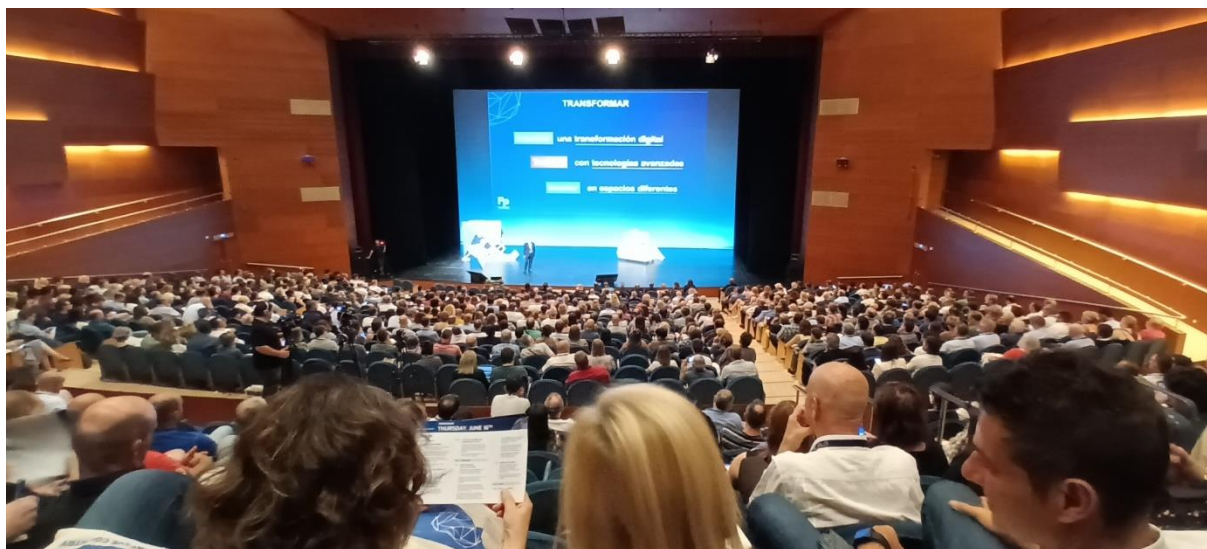
Slika 2: Veliko smo se naučili tudi od primerov, ki so jih predstavili kolegi iz Singapurja, Portugalske, Avstralije, Velike Britanije, Irske, Belgije in drugih.

Gabrijela Krajnc je zapisala: »Cilj izmenjave je bil vključitev v razprave o ustreznih temah z drugimi udeleženci iz vsega sveta. Vključili smo se v različne skupine in si nato izmenjali izkušnje in mnenja. Predstavili smo naše izkušnje pri sodelovanju s podjetji, razvijanju mehkih veščin pri študentih, ki jih dandanes delodajalci po celem svetu izpostavljajo kot izjemno pomembne, ter razvojnih in raziskovalnih projektih, ki se jih lotevamo skupaj s študenti.