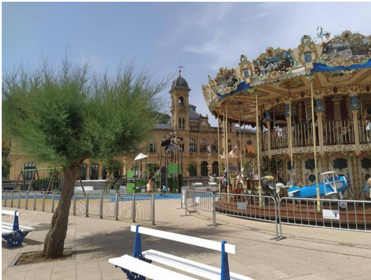
Slika 3: Poleg udeležbe na kongresu smo si ogledali tudi staro mestno jedro Donostie, špansko San Sebastiana. Na vhodu v ta del mesta je mestna hiša Donostia.