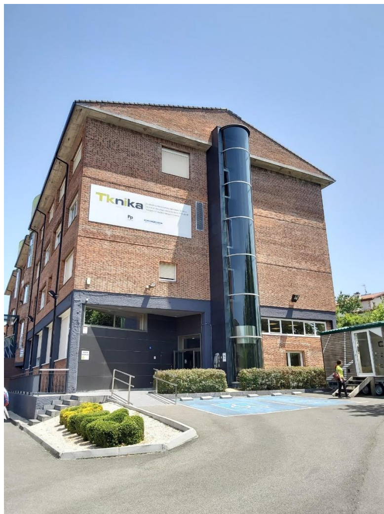
Slika 4: Tknika

O posameznih ključnih izzivih kot npr. peta industrijska revolucija, prihodnost dela in vplivi na poklicno izobraževanje in usposabljanje, uporabne raziskave, digitalizacija, trajnost, enakost in inkluzija, migracije, ..., je bilo govora na plenarnih predavanjih. Za posamezne ključne izzive v poklicnem in strokovnem izobraževanju in usposabljanju so bile oblikovane tudi afinitetne skupine.