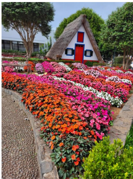
Slika 7 in 8: Slikoviti oranžno-modri cvet strelcije v mestnem parku Funchal (nacionalni cvet Madeire) in čudovit nasad vodenk ob naselju tradicionalnih starih hišk v Santani

Po predlogah udeleženk zapisala Nastja Beznik, 17. 8. 2022