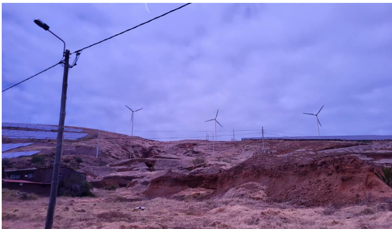
Slika 6: Med sončnimi paneli so nameščene številne vetrnice

Saša Kocijančič: »Poleg izboljšav na strokovnem področju – komunikacija v angleščini, nove metode dela, medkulturne povezave in mreženja za nove projekte, so se predavatelji dotaknili tudi VOP in GDPR. Trajnostni učinki izmenjave: pomoč pri delu s tujimi udeleženci IO. Če se želimo izogniti težavam pri objavah fotografij, posnetkov, je rešitev animacija. Pridobila sem kontakte za nove projekte in veliko pridobila na osebni in strokovni razvoju zaradi mreženja z učitelji strokovnih šol iz 8 držav, izmenjave izkušenj pri delu s projekti Erasmus+, fazami projekta in specifikacijami posameznih faz s predstavitvami izkušenj pri reševanju izzivov, vedenja, da dobro delamo in da ne smemo pozabiti na proslavljanje uspehov. Poudarek je bil na argumentiranju in idejah za naprej – organizacija Erasmus+ izmenjav tudi za udeležence IO.«