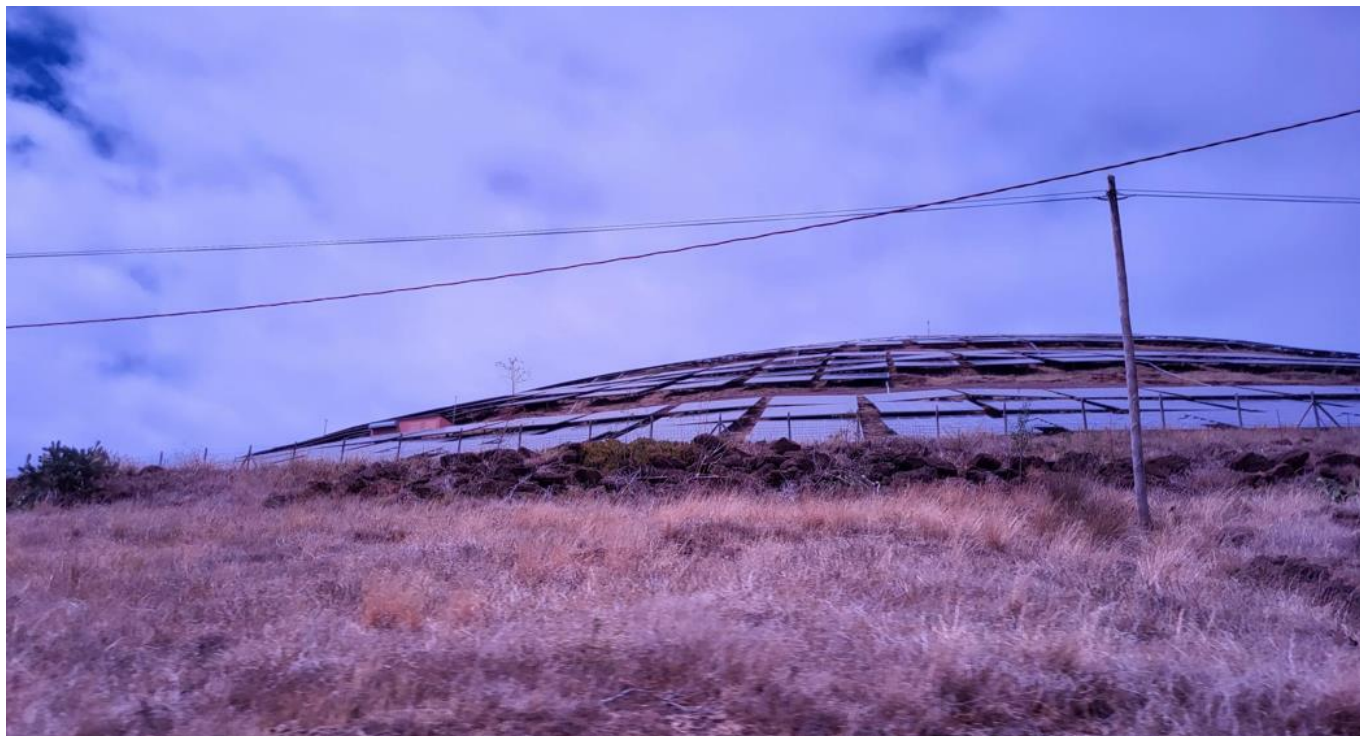
Slika 5: Več kot 3 km po otoku Madeira so nameščeni sončni paneli