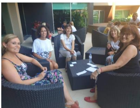
Sliki 1 in 2: Medkulturni delavnici z udeleženkami iz Nemčije, Litve, Slovaške, Madžarske, Grčije

Pohvalno je bilo, da so izvajalci poskrbeli tudi za deljenje vseh izkušenj in zaključkov vseh udeležencev in skupin seminarja.»